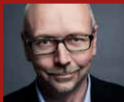
Magnus Höij Teknik&Designföretagen